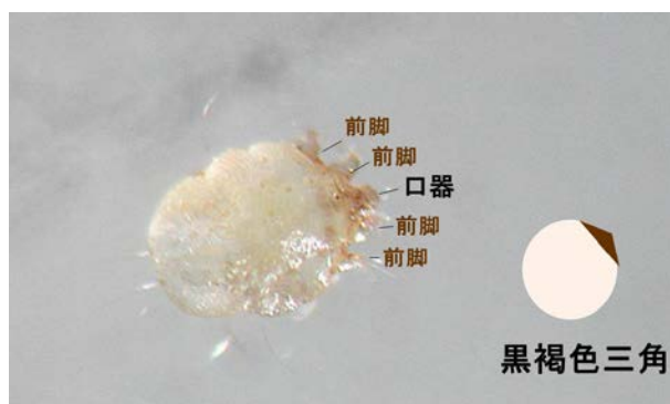
図5 ヒゼンダニの外観 口器と隣接する前脚が黒褐色をしている

疥癬トンネルはヒゼンダニの巣穴で、その先端に虫体がいることをお話ししました。虫体の見え方について述べます。ヒゼンダニは、体の前方に口と前脚があり、これらの部位が黒く色づいています(図5)。そのため肉眼で見ると、ヒゼンダニは微細な黒点として見えます。20代、30代の若い先生方は、目のいい人であれば、ヒゼンダニ