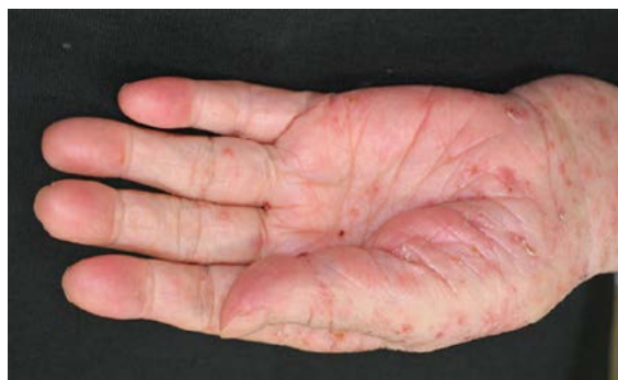
図1 手掌、手首の皮疹

次に、疥癬を積極的に診断していくときのポイントについて述べます。ポイントは3つです。一つめは、手や手首に皮疹があることです(図1)。疥癬を