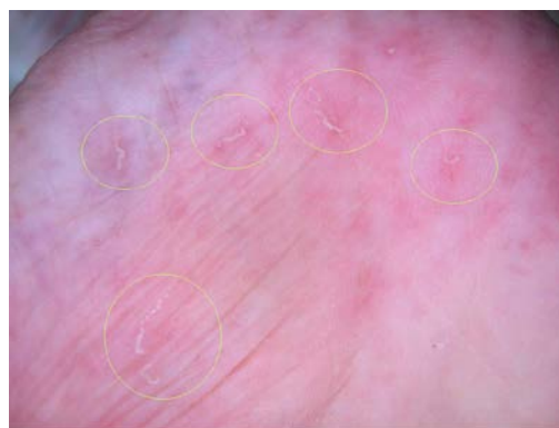
図4 手掌の疥癬トンネル

疥癬トンネルは、肉眼で見ると、細い針先で引っ搔いたような線状の皮疹です(図4)。長