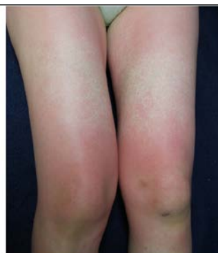
成人のパルボウイルスB19感染症：発熱1週間後、四肢・体幹の粟粒大の紅色丘疹多発し融合傾向を示した。関節痛を伴っていた。PVB19-IgM陽性