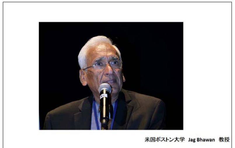
米国ボストン大学 Jag Bhawan 教授