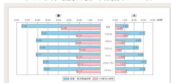
6歳未満の子供を持つ夫の家事・育児関連時間 (1日当たり・国際比較) 内閣府(2016年)

まず、現代の子育て事情をお話しします。 「共働き世帯の推移」の資料を見ると1997年に「共働き世帯」が上回り、その後は右肩上がりに増加しています。第一子出産前後に女性が就業を継続する割合は、2人に1人となりました。しかし、2016年における6歳未満の子供を持つ夫の家事・育児関連に費やす時間は1日当たり83分であり、ほかの先進国と比較して低水準にとどまっています。